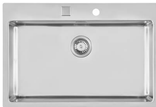
Spülbecken KE Aufliiegend I Flächenbündig 2266 050